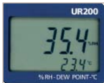
Display UR 200