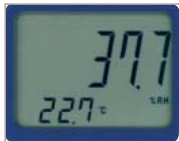
Display UR 100