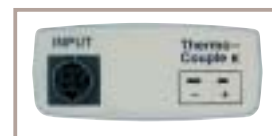
Ingresso termocoppia K UR 200